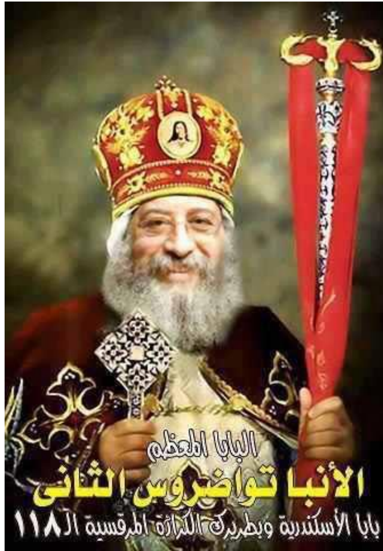
H.H. Pope Tawadros, II Pope and Patriarch of the See of St. Mark, The Coptic Orthodox Church In Egypt and Abroad